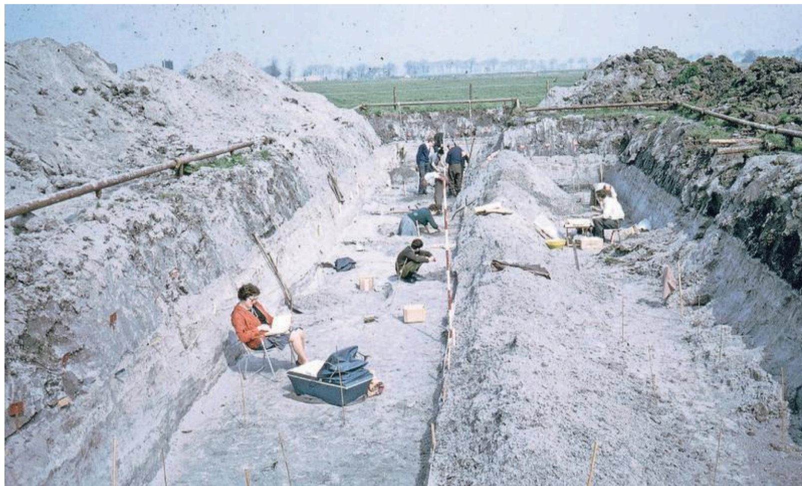
Ten tijde van de opgravingen bij fort Velsen 2.

„Die sporen zijn in 1966 al gezien maar nooit op waarde geschat”, meldt Bosman, die in 1997 als wetenschapper al promoveerde op opgravingen in Velsen. „En ik zal je eerlijk vertellen dat ik gesterkt werd in mijn eigen ontdekking sinds in Valkenburg vorig jaar een vergelijkbare vondst is gedaan. Daar heeft ook een groot legioenkamp gelegen. Bovendien vond ik bij het onder-