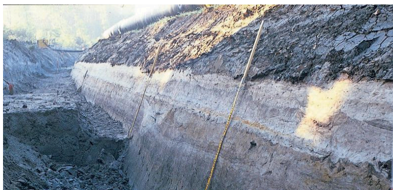
Detail van Romeinse sporen in Velsen.